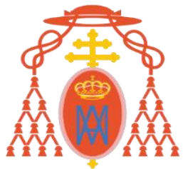
Archidiócesis de Madrid

“Defender la creación y al hombre mismo nos hace ver que ecología humana y ecología ambiental han de ser un compromiso de todos los cristianos.” (Monseñor Carlos Osoro Sierra, Cardenal Arzobispo de Madrid. El Sagrado Corazón y la Ecología. 2015).