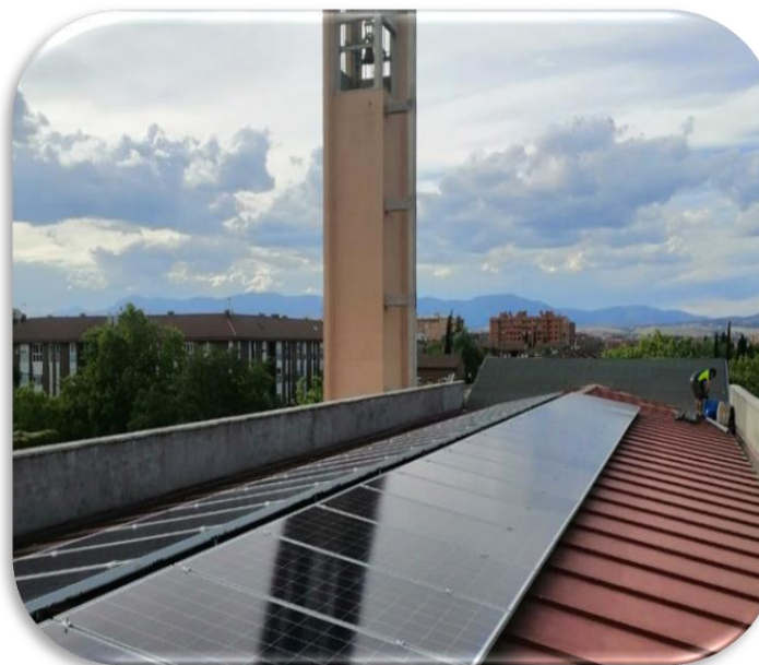
Fomentar paneles solares en parroquias