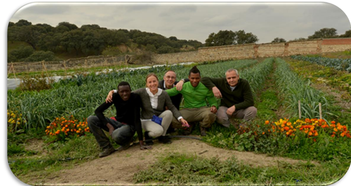
Apojar proyectos locales, como el Huerto Hermana Tierra (SERCADE)