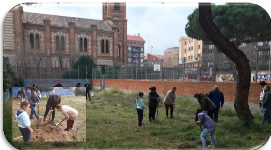
Inicio del huerto ecológico sostenible parroquia Santa Cristina y Santa Margarita (Vicaria VI). Concienciación