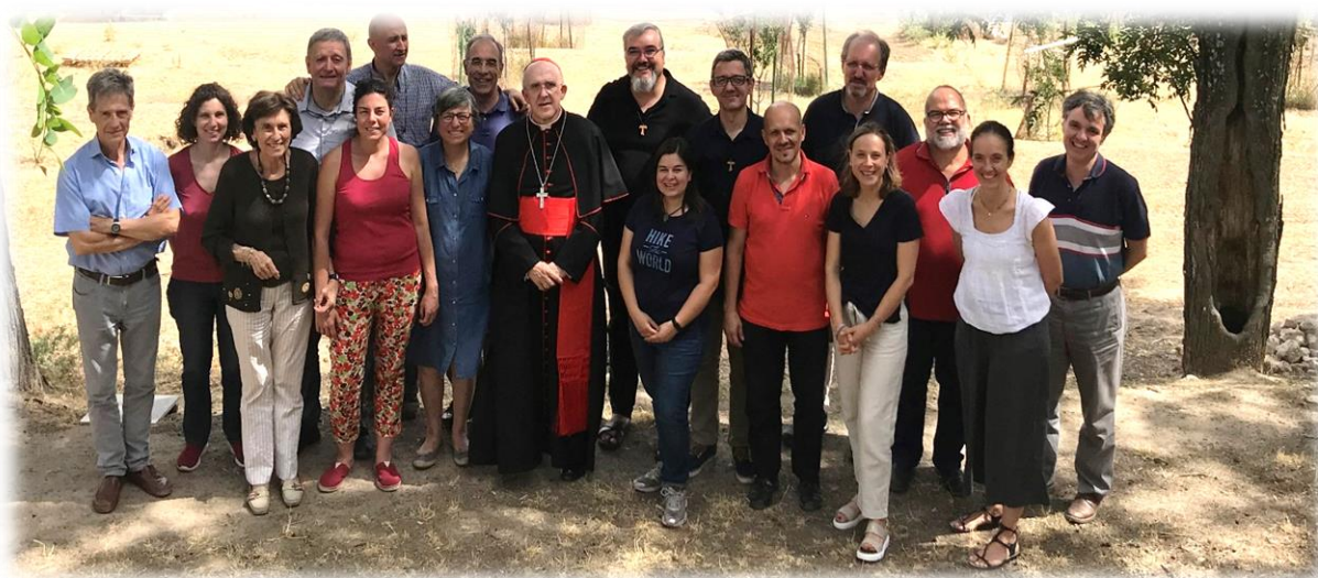
Foto: Convivencia de programación de la Comisión Diocesana de Ecología Integral 2019

Ya hay diferentes diócesis, en España y en el mundo, en el que se van tejiendo estas redes de conocimiento eco-social. Es, por lo tanto, es necesario comunicarnos también internamente y sumar colectivos, coordinándose con la Comisión Diocesana de Ecología Integral y las vicarías.