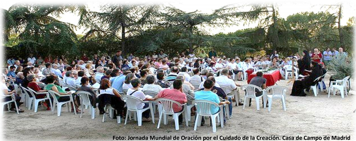
Foto: Jornada Mundial de Oración por el Cuidado de la Creación. Casa de Campo de Madrid

actividades se encuentran recogidas en las memorias de actividades que pueden seguirse en su página web y en el Portal de Transparencia 9 de la Archidiócesis de Madrid.